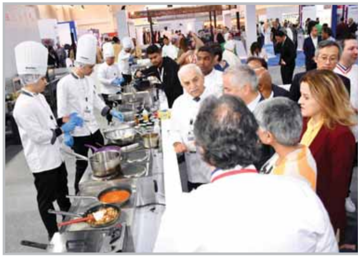
■ جانب من فعاليات المعرض

270 مليار دولار إيرادات الفنادق والترفيه بالشرق الأوسط... والسوق بحاجة إلى 80 ألف شخص خلال 4 سنوات