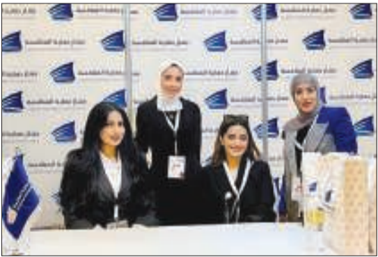
جناب الجهاز في المعرض

«حمية المنافسة» والرد على الاستفسارات المتداولة لتحقيق بيئة تنافسية قائمة على أسواق عادلة.