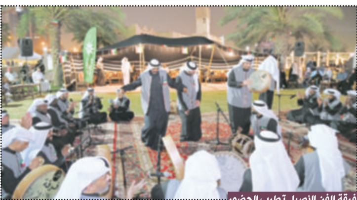
فرقة الفن الأصيل تطرب الحضور