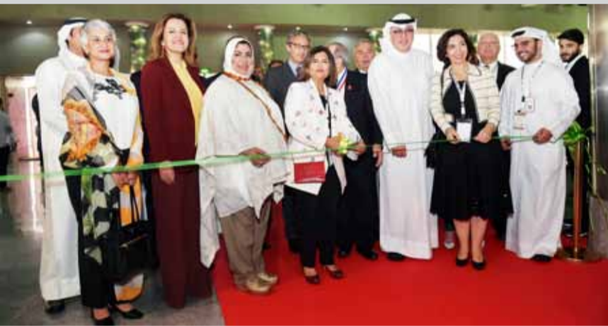
العنبري خلال افتتاح المعرض

■ 270 مليار دولار.. إيرادات قطاع الضيافة في الشرق الأوسط خلال 2022