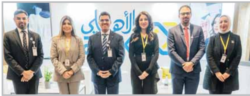
■ صورة جماعية خلال رعاية المؤتمر