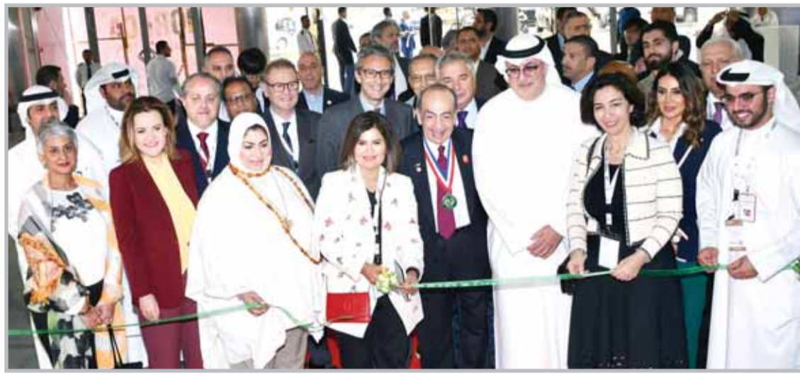
■ العنبري تقص شريط الافتتاح