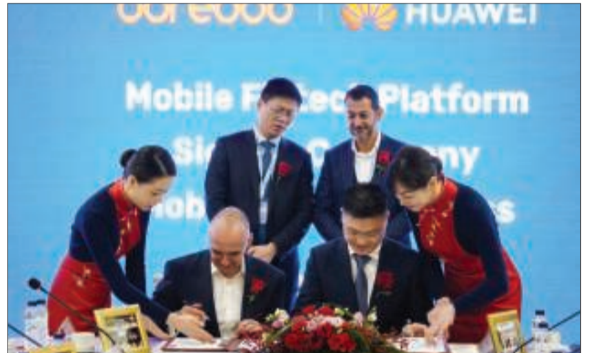
فخرو وبينغ يوقعان الاتفاقية

أبرمت مجموعة (Ooredoo) اتفاقية تعاون مع شركة (Huawei) لتوفير خدمات التكنولوجيا المالية في جميع الأسواق التي تعمل فيها المجموعة، باستخدام منصة التكنولوجيا المالية عبر الجوال من (Huawei).