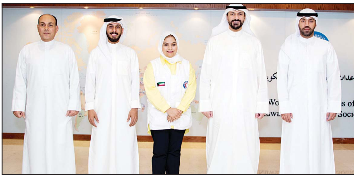
Gulf Bank team

The Bank has continuously improved its performance over the years, through an expanded revenue structure, diversified funding sources, and a strong capital base. The adoption of state-of-the-art services and technology has positioned it as a trendsetter in the domestic market and within the MENA region.