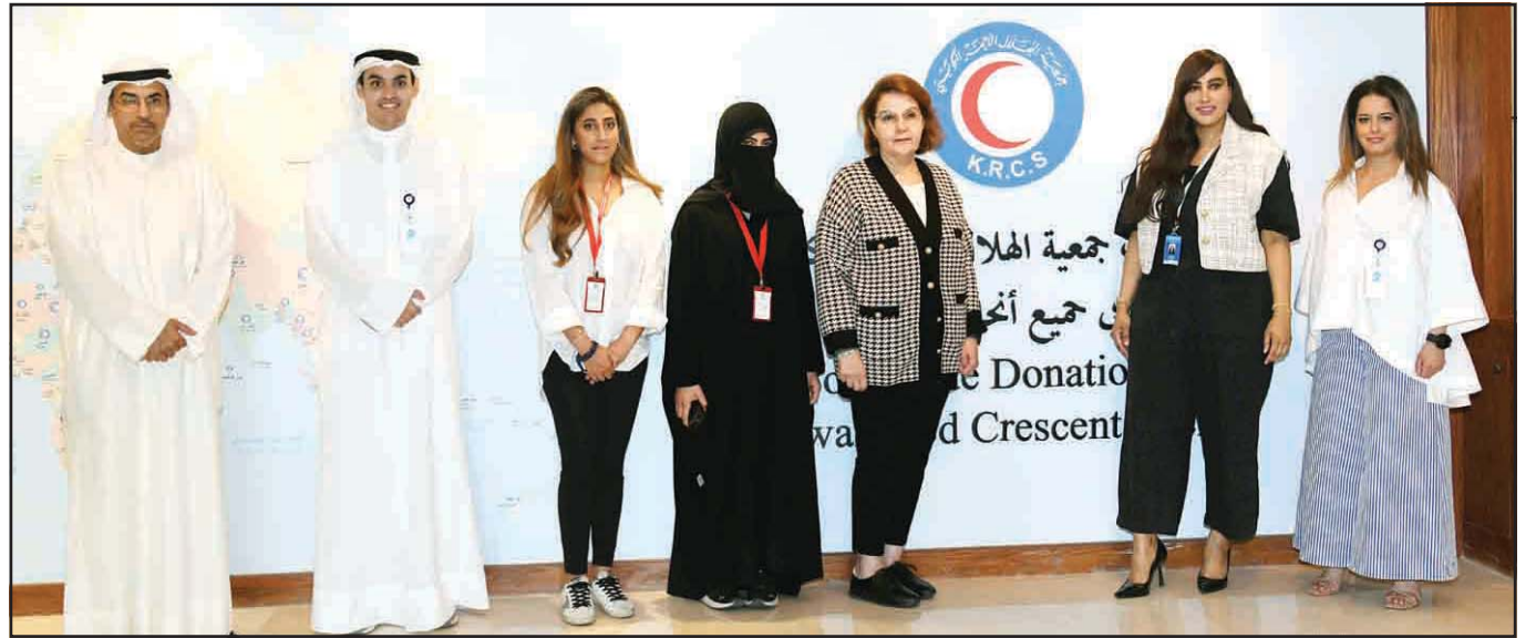
Burgan Bank team with the KRCS team