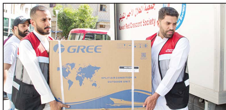
Gulf Bank team distribute electronic appliances

He further pointed that the contribution to the Red Crescent's campaign to distribute electrical appliances to needy families in Kuwait is part of the various charitable initiatives launched by Gulf Bank during Ramadan, to support those who face difficult circumstances. Other initiatives include distributing Ramadan food baskets "Majlat Ramadan" to needy families, in addition to other ongoing charitable initiatives throughout