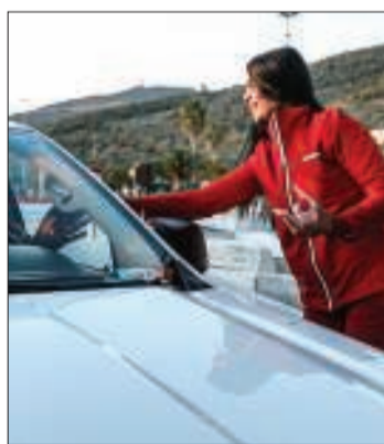
توزيع كسرة الصيام في تونس

ولفت آل ثاني إلى أن «أريد» الجزائر تنفذ عدداً من المشاريع بالتعاون مع الهلال الأحمر الجزائري، من بينها افتتاح مطعم «الهلال» لتقديم الإفطار إلى الصائمين، وتوزيع المواد الغذائية الأساسية على المحتاجين في عدد من محافظات البلاد، كما تنفذ، من خلال جهد تعاوني مماثل مع الجمعية الوطنية