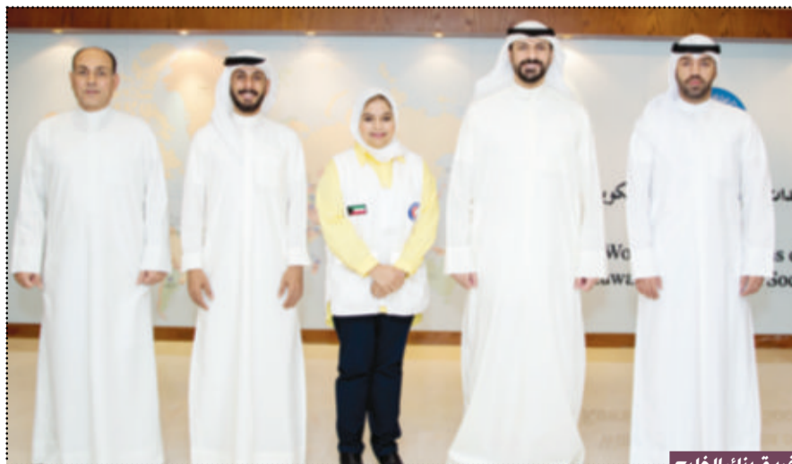
فريق بنك الخليج

أعلن بنك الخليج عن مشاركته في الحملة الإنسانية التي تقودها جمعية الهلال الأحمر، لتوزيع الأجهزة الكهربائية على الأسر المتعففة في الكويت، وذلك في إطار التزاماته نحو الحفاظ على الاستدامة المجتمعية، ودعم جهود مؤسسات المجتمع المدني.