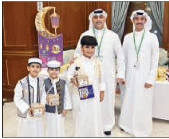
فريق «التجاري» أثناء حفل قرقيعان محافظة مبارك الكبير

مناسبة القرقيعان وشهر رمضان الفضيل. وفي ختام الحفل، تقدمت قيادات محافظة مبارك الكبير بالشكر من «التجاري» على رعايته لهذه المناسبة التراثية ومساهمته في رسم الابتسامة على وجوه الأطفال وإضفاء السعادة على قلوبهم احتفالاً بمناسبة القرقيعان، مشيدين بمبادرات البنك التي دائماً ما تركز مفهوم المسؤولية الاجتماعية الشاملة.