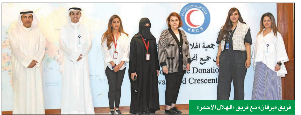
فريق «برقان» مع فريق «الهلال الأحمر»

المستمر بدعم العائلات في جميع أنحاء الكويت. يسرنا أن تكون دائماً جزءاً أساسياً من المبادرات الإنسانية التي ترتقي بمفهوم الخاص، وتسهم في النهوض بالمجتمع وتعزيز قيم ومبادئ التواصل والعباءة والخير، من خلال رفع مستوى الوعي بأهمية الجهود الإنسانية، وضرورة تحقيق التنمية المستدامة لأفراد المجتمع.