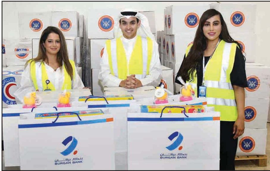
Burgan Bank team