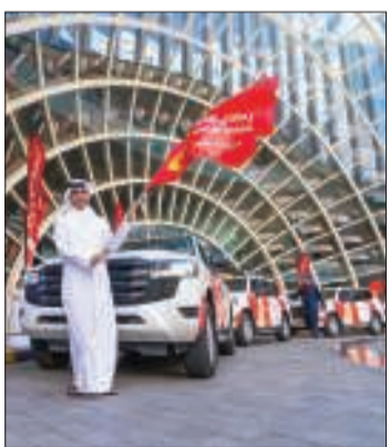
إحدى حملات الشركة في عُمان

ملتزمون بدعم المجتمعات التي نعمل فيها وإحداث أثر إيجابي في حياة أفرادها