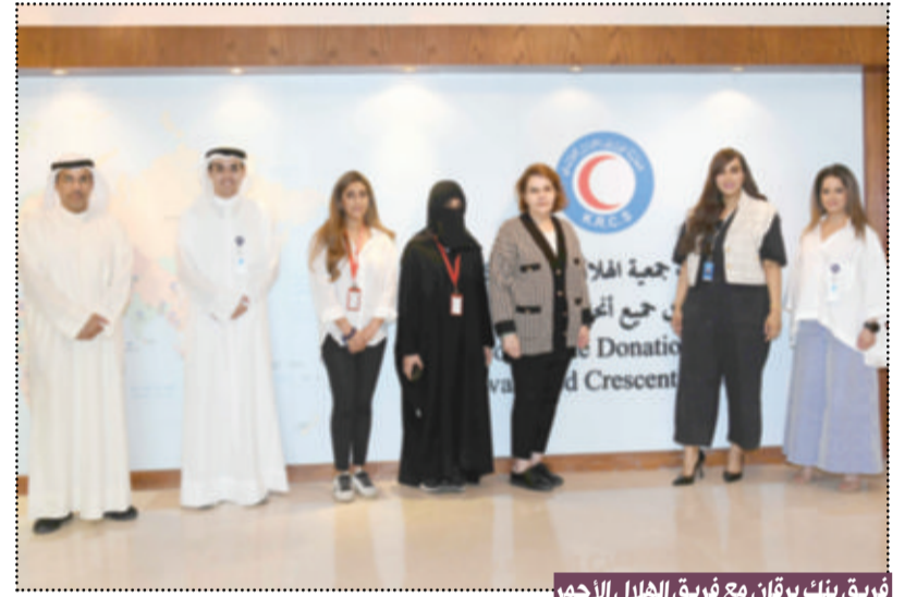
فريق بنك برقان مع فريق الهلال الأحمر

التزاماً ببرنامج المسؤولية الاجتماعية للشركات خلال شهر رمضان المبارك، هذا العام، يجتهد بنك برقان بالتعاون مع جمعية الهلال الأحمر الكويتي من خلال تنظيم مبادرة توزيع سلات غذائية رمضان، وذلك بهدف ترسيخ قيم التكافل والعطاء والرحمة في المجتمع. وينطلق هذا العمل الإنساني تحت مظلة الشراكة الاستراتيجية الراسخة بين البنك وجمعية الهلال الأحمر الكويتي، والهادفة إلى دعم الأسر المتعففة في مواجهة التحديات المعيشية. وتضمن هذه الحملة مشاركة مجموعة من فريق بنك برقان بتوزيع سلات غذائية رمضان متكاملة على العائلات في مختلف مناطق الكويت، لمدة يومين، إلى