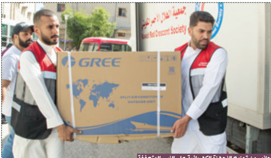
جانب من توزيع الأجهزة الكهربائية على الأسر المتعففة