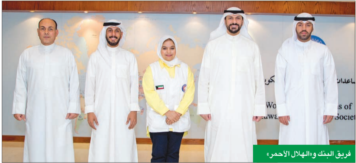
فريق البنك و«الهلال الأحمر»

المستويات المجتمعية والاقتصادية والبيئية، عبر العديد من المبادرات التي يتم انتقاؤها بعناية لتعود بالنفع على البنك والمجتمع، بما يتوافق مع أهداف الأمم المتحدة للتنمية المستدامة ورؤية الكويت 2035.