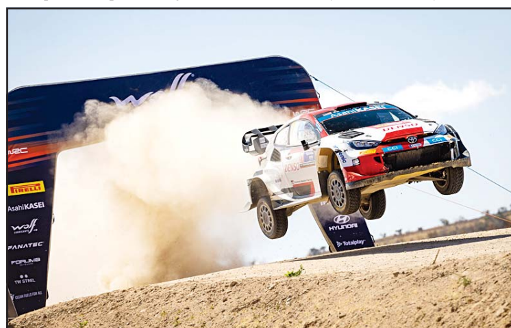
Toyota Gazoo Racing 2023 FIA World Rally Championship Round 3 Rally Mexico

performance to seal the victory with the fastest time on the rally-ending Power Stage in the No. 17 GR YARIS Rally1 Hybrid Electric Vehicle, securing a maximum score that puts him top of the championship standings by three points despite having contested