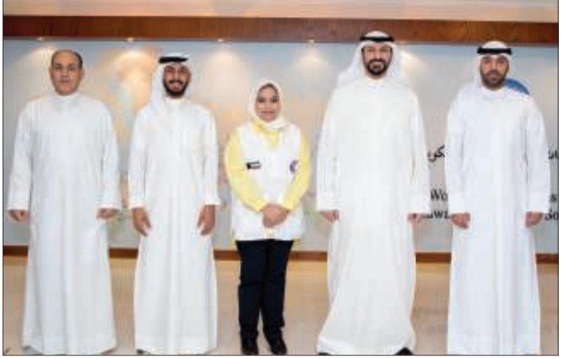
فريق «الخليج» المشارك في الحملة

بشارك بنك الخليج في الحملة الإنسانية التي تقودها جمعية الهلال الأحمر، لتوزيع الأجهزة الكهربائية على الأسر المتعففة في الكويت، وذلك في إطار التزاماته بالحفاظ على الاستدامة المجتمعية، ودعم جهود مؤسسات المجتمع المدني.