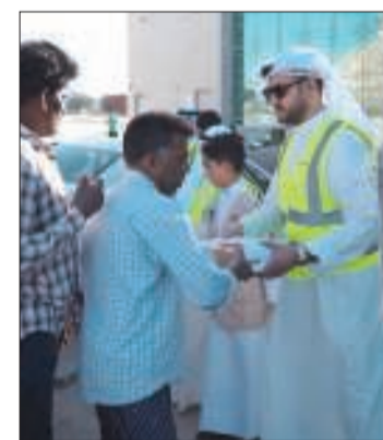
توزيع وجبات الإفطار في الكويت

وذكر أنه في قطر، حيث يقع مقر المجموعة، أطلقت «أريد» عدداً من المبادرات تحت شعار «تواصل وعطاء»، وحرصت على التعاون مع عدد من الجهات المحلية، حيث تنظم مجموعة من الفعاليات في كل من مشرب قلب الدوحة، ومجمع ميادين لوسيل للترفيه، وملعب نادي لوسيل الرياضي. وبيّن آل ثاني أن الأنشطة المخططة لشهر رمضان تشمل فعالية القرقيع، وموكب السيارات الكلاسيكية، وتوزيع الحلويات في مقصورات الترام، والمسخر الأسبوعي، ورفيق الخير، وبطولة النيشان، ودوري «أريد» لنادي الفرج،